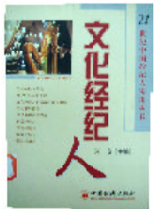
《文化经纪人》 汪京 主编 中国经济出版社

文化经纪人泛指与文化市场相关的众多行业的经纪人群体，即在演出、出版、影视、演出、娱乐、美术、文物等文化市场上为供求双方充当媒介而收取佣金的经纪人。文化经纪人能有效整合社会文化资源，将文化与市场的更好地联系起来，推动文化市场的发展，促进第三产业的发展和世界文化的交流。