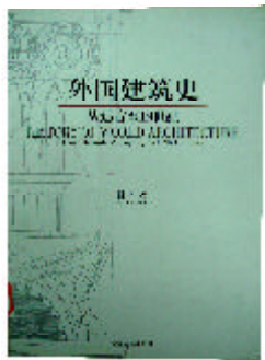
《外国建筑史》 陈平 著 东南大学出版社

先秦人口是中国历史人口研究中的一个薄弱环节。本书总结了前人的研究成果，并对先秦人口的理论问题进行了专门分析，力图在理论上搭建一个相对前人来说较为全面的历史人口学体系，同时也在先秦人口方面勾勒出一个历史人口状况的轮廓或学科体系的框架。本书还通过借鉴其他学科理论，综合运用考古、文献、民族学、人类学、统计学、生物学等多种学科的研究方法和研究成果，拓展了历史人口研究的方法。