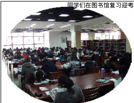
同学们在图书馆复习迎考

诸子录其要论，以为外集，共合1,324篇。康熙逐篇品评，命徐乾学等人编注。凡正文以墨色示之，前人诸家评语列诸书的天头，分别以黄、绿、蓝三色示之，康熙御批并本朝诸臣注释亦列诸书眉，用朱色标示。另正文有朱色断句。其雕镂、套色、刷印皆极精工，朱、墨、黄、蓝、绿五色鲜明艳丽。