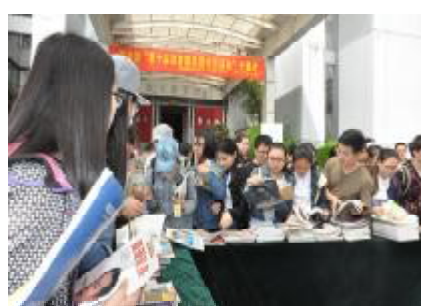
开幕式上经典名著、书刊赠送