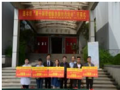
芜湖市邮政局捐赠图书活动