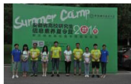
研究生信息素养夏令营