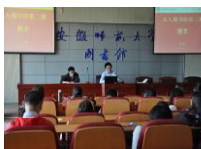
第二期“真人图书馆”