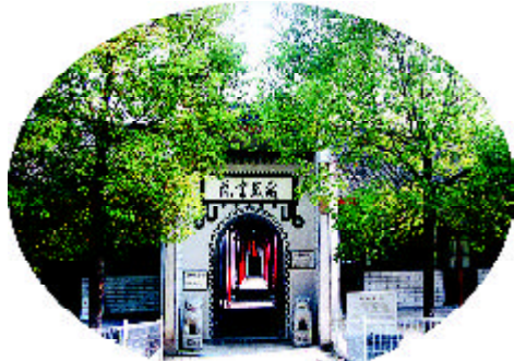
敬敷书院（国立安大时期图书馆）

图书从安庆装船运至湖北沙市，原打算在内地复校，因时局恶化、内迁大学较多，教育部未予同意。随后，奉教育部令及省政府指示，学校部分图书被运至蓝田，交国立师范学院（湖南师大前身）代管，大部分图书则转交重庆国立编译馆。当时图书馆有中英文图书杂志20多万册。