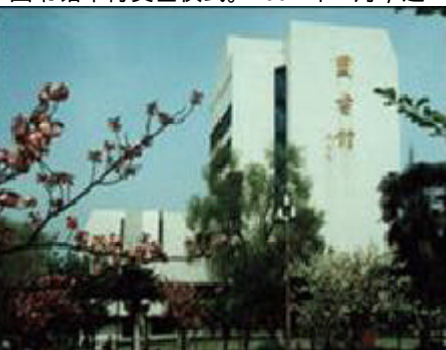
赭山校区图书馆（1997年—）

2002年8月，学校决定在芜湖市城南高教园区建设新校区。朱敬文教育基金会捐资1000万元人民币，用于新校区图书馆建设，学校将新校区图书馆命名为“敬文图书馆”。2005年4月6日，敬文图书馆举行奠基仪式。2007年4月，近