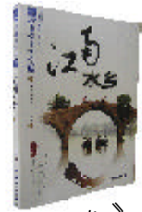
《江南水乡》 秦隽 龚美玲文/摄 中国旅游出版社

用几个华丽的辞藻去定义江南水乡都将是一种徒劳。人们只能亲身去感受她那古朴和清雅的气质,在本书中,作者使用大量的图片以便使大家能够“身临其境”。