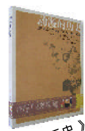
《动漫的历史》 周兰平 编著 重庆出版社

“动漫”,早已超越了动画和漫画的传统范畴。本书把动画与漫画两个领域在世界各国各历史时期的发展状况,以及为“动漫”作出重要贡献的国家、重量级大师和作品尽可能全面地呈献给了读者。